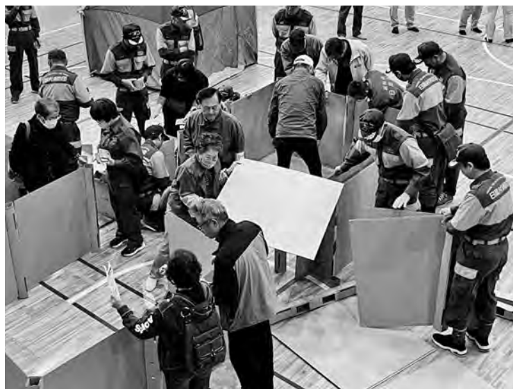
防災訓練 段ボールで間仕切り組み立て体験

あるいの町とも協議の上、来年度設置が予定されている任意協議会への参加意向を県へ伝えていくものの、非常に重い財政負担が強いられることが予想されるため慎重に対応していきたい。