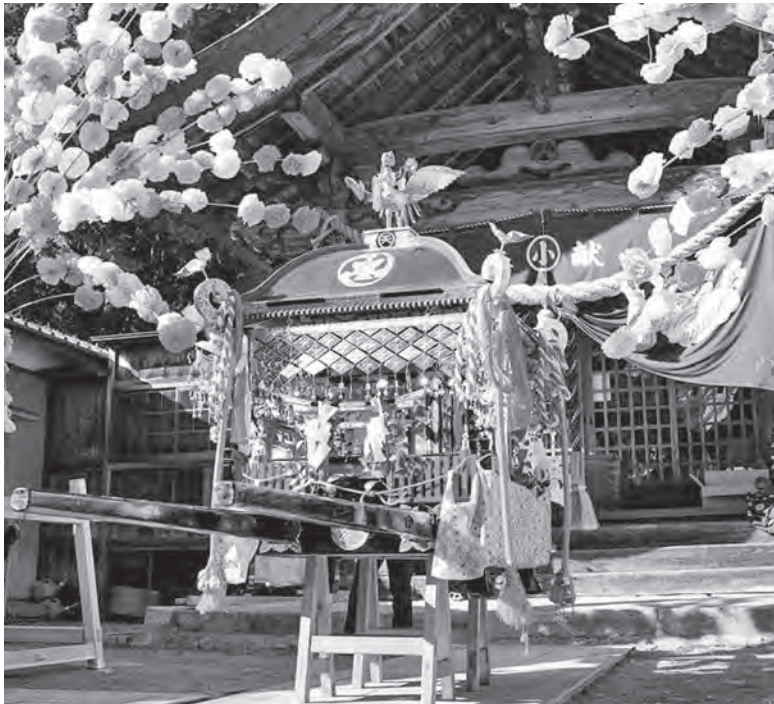
おなばれ出発前の神輿 小村神社 秋の大祭

当組を今年やってみて、前回経験者が皆無に近く、前年当組自治会に逐一問い合わせしながらことを進めた経験から、村に継承保存会を組織し、しめ縄づくりやわら草履づくりなど、行事に不可欠なものを伝承していくことを提案する。直接神事は援助できなくても、保存会を支援すれば可能と思う。