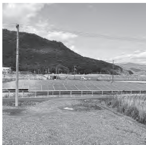
トマトハウス団地の脱炭素化が期待される太陽光発電施設

答弁 大川総務課長 4カ所の指定避難所において井戸掘削の検討を行ったが、費用がかさむため断念した。新たに地上設置の耐震性貯水タンクの活用を検討する。 併せて、令和8年度には災害協力井戸の要綱整備及び登録に必要な経費などを予算計上し、災害時の生活用水確保を推進する。