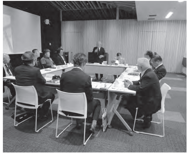
11月7日 岡山県矢掛町議会 研修内容「村まるごとデジタル化事業について」