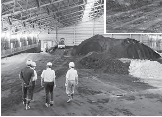
現在のエコサイクルセンター搬入状況

11月23日に茂平マラソンにて婚活イベントを開催し、男性5人、女性4人の参加があった。2チームをつくりマラソンを楽しんだ後、アルモで交流会を行い大変盛り上がったとの報告を受けている。