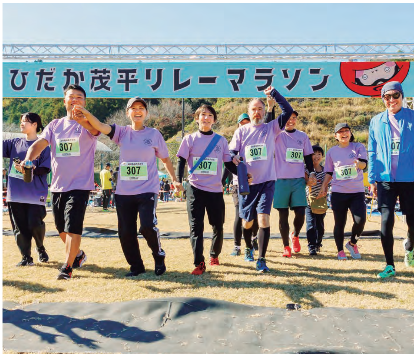
131チーム676人のランナーが参加した「ひだか茂平リレーマラソン2025」