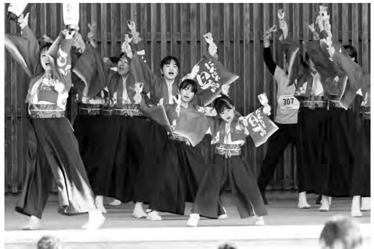
「ひだか茂平リレーマラソン2025」 よさこいが披露された

11月23日に「ひだか茂平リレーマラソン2025」が晴天のもと開催され、131チーム、676人のランナーが参加した。会場では、オムライスの早食い競技や日高