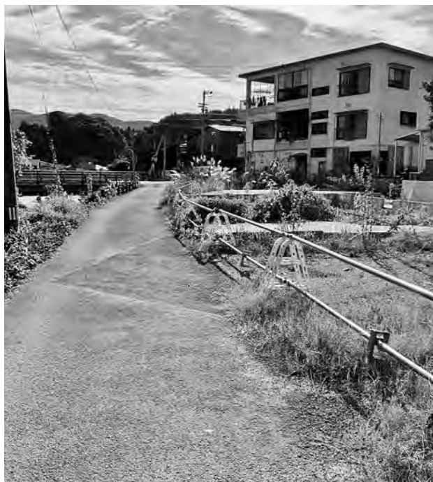
国道から日高クリニックへの村道の適正な維持管理を望む

質問 村道奥ノ谷大橋西線は、大変な荒地になっている。完成にはまだ時間がかかると思う。このままの状態ではいけないのではないか。