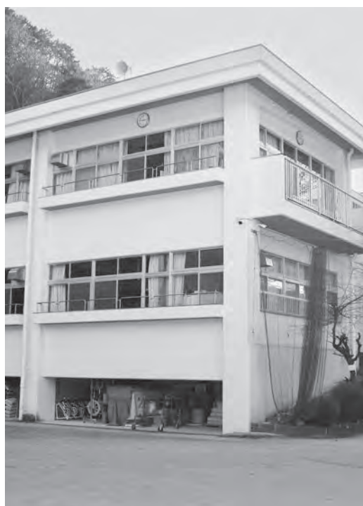
長寿命化を検討する能津小学校校舎