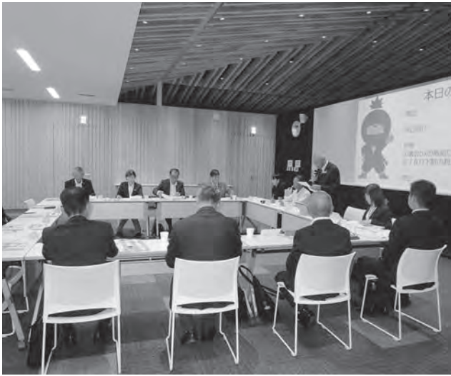
10月21日 和歌山県みなべ町議会 研修内容「DXの取り組みについて」 「JR日下駅の利活用について」