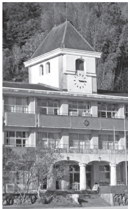
窓ガラスの耐震対策と安全確保を(日下小学校)