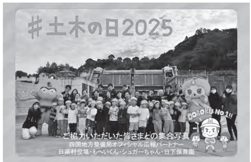
新日下川放水路で日下保育園児のダンスにより「土木の日2025」を盛り上げた