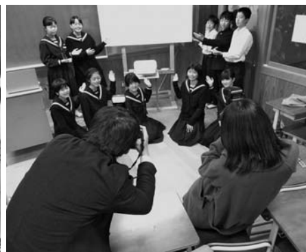
読売新聞社・高知新聞社からの取材