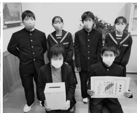
社会福祉協議会へお届けしました