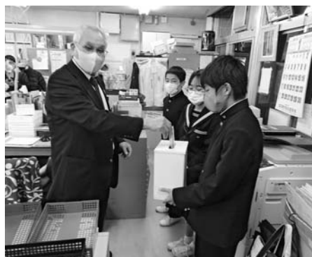
日高村役場での募金活動