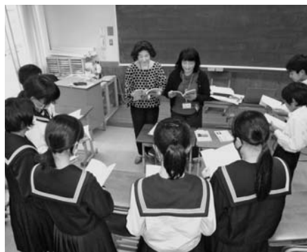
地域の方から朗読の指導を受ける