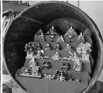
ひな飾り(左より伊気神社石段、旧松岡酒造石積・酒樽)

3月3日は桃の節句、日高酒蔵ホール(旧松岡酒造)での「ひだかさかぐらひなまつり」(2月27日～3月7日開催)では歴史ある建物や酒造道具に飾られた様々な種類のおひな様を見ることができます。そこで、今回は「ひな祭り」に関するデザインを紹介します。