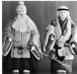
高砂人形(著者私物)

高知では嫁を迎えて初の3月3日に「嫁節句」を祝うならわしがあります。嫁節句では一般的にお嫁さんに対して里方から高砂人形(松の精霊が翁と媼の姿で出てくる能の「高砂」にちなむ)が贈られます。能の「高砂」は夫婦愛や長寿を寿ぐ作品で、結婚式で新郎新婦が座る「高砂席」はこの能を名の由来としています。