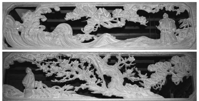
欄間意匠の高砂・松竹梅(松岡家住宅)

持ち物は翁は熊手、媼は箒。覚え方は「お前百(掃く)まで、わしゃ九十九まで(熊手)」