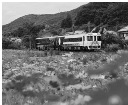
日高村内を走る観光列車で上映中 「志国土佐時代(とき)の夜明けのものがたり」

日高中学校では地域ボランティアに、積極的に学校の授業に関わっていただいております。国語科で生徒の朗読の授業を参観された地域の方が、JR四国の観光列車「志国土佐時代(とき)の夜明けのものがたり」内で朗読をしないかと提案されたことがきっかけで実現しました。日高村は大正13年に土讃線が最初に開通した区間であり、村内には見どころや特産物がたくさんあります。これらを、「にんじゃもへえ」の朗読・イラストに盛り込んで完成したのが今回の動画です。呼びかけに応じた生徒は10名で、部活動の関係で、毎週水曜日をボランティアの活動日とし、朗読・イラスト・掛け声等の担当に分かれて地域の方から直接指導をしていただきました。はじめは、土佐弁のアクセントや語りの間に苦勞していましたが、地域ボランティアの皆さんから2カ月の指導のおかげで、多くの方に披露できるほど成長しました。観光列車が運行している日は、生徒は授業や部活があるため参加できず、DVD作品にすることで、いつでも視聴できるようになりました。完成試写会では、読売新聞社・高知新聞社も取材に来校し、新聞で紹介してくれました。作品は観光列車の上り便で、日高村を走行時に上映されています。日高村立図書館「ほしのおか」でもDVDを貸し出していますので、村民の皆さんもぜひご視聴いただければ幸いです。