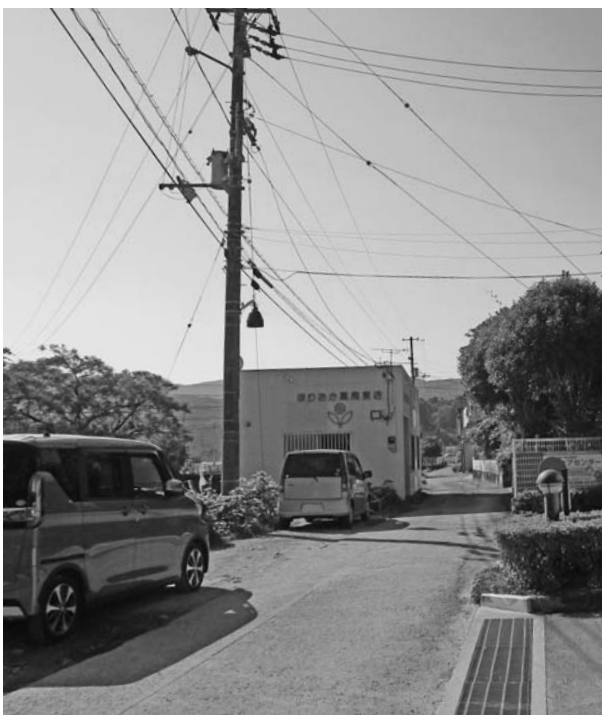
拡幅予定の日下川下流左岸の村道