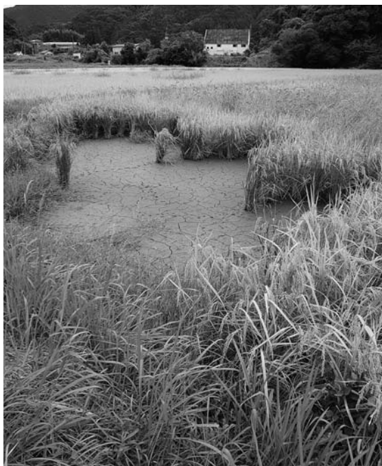
ジャンボタニシによる食害で、水口の近くから被害が出ている