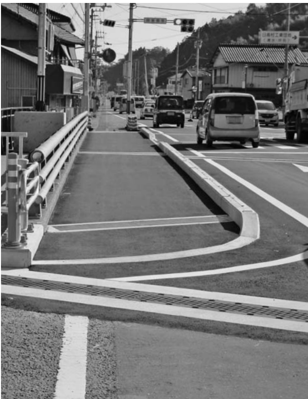
並列する新日下大橋歩道橋と旧歩道橋