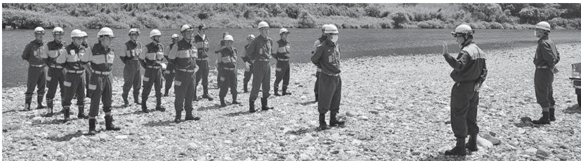
江尻での舟艇訓練

ために活用してほしいと寄付申請があり、審査した結果、申請を受け入れることとした。