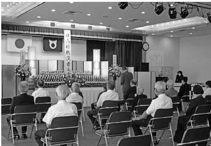
終戦から75年 戦没者追悼式