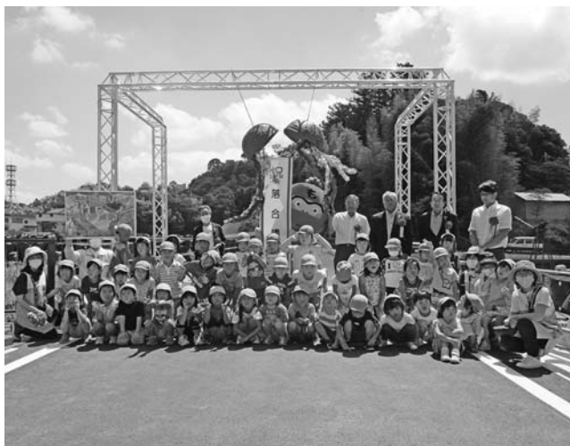
日下保育園児と落合橋渡り初め

この橋は、県道谷地日下駅前停車場線と、村道清水線及び今市石田線をつなぐ道路として、幅員5メートルの橋梁で、新放水路トンネル呑口付近の構造物としては、最初に完成したものである。