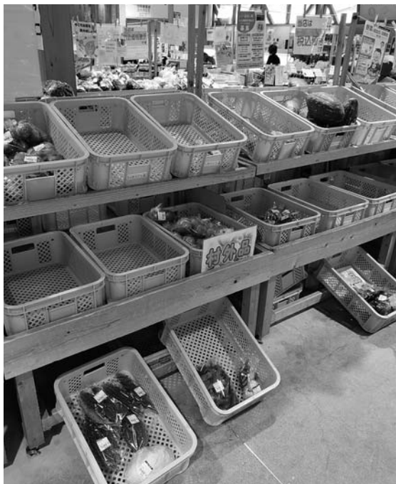
トマトが出てくるまで野菜が中心になるべきだが、10時にはなくなる

質問 コロナと共存という形の中で、花火や祭り、各種イベントなど、村全体を考えて、住民から必要とされる文化や芸能及び伝統を維持していくことも必要だと思いが。