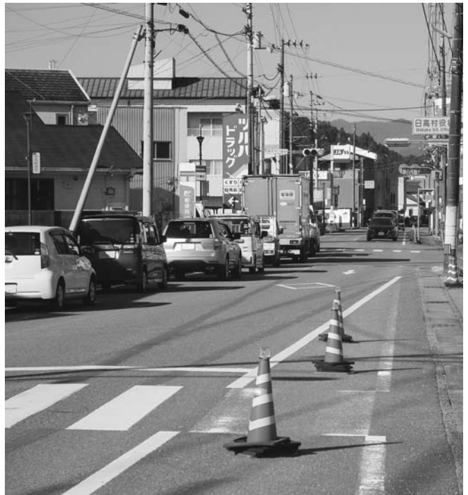
今後の改良が待たれる国道33号、佐川町方面

いの町方面は、役場から鍛冶屋付近まで、国道の南と北に歩道を計画。7月から工事着手を予定していたが、少し計画が遅れている。 佐川町方面は、役場から日下駅付近まで歩道整備を要望しており、国の測量調査が実施されており、具体的なことは確定していない。