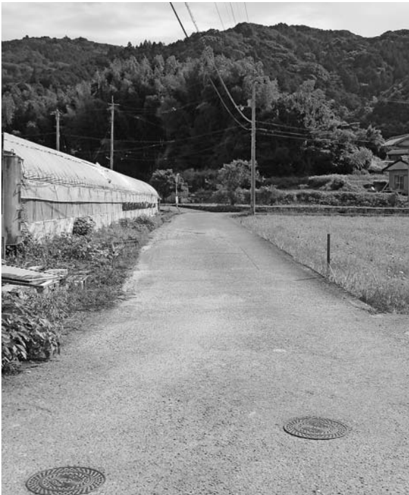
交通量が多くなった長山田村道