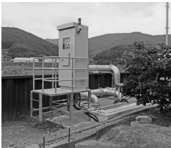
馬越南地区排水ポンプ設置完了