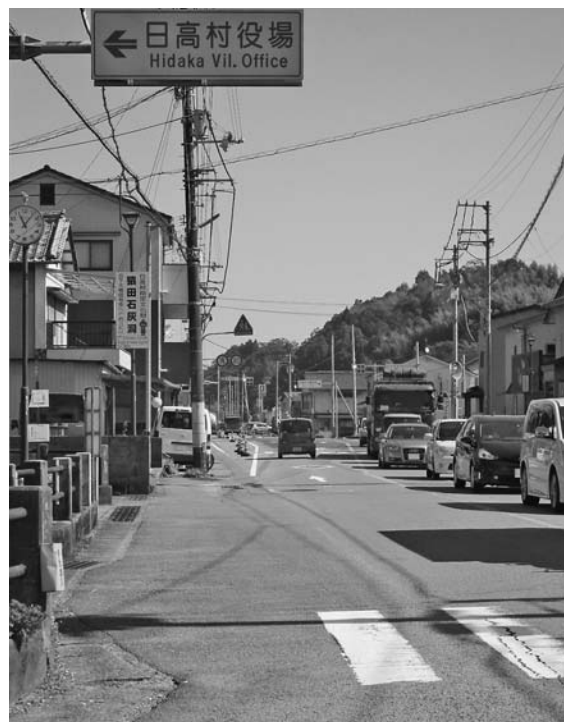
歩道整備が待たれる日下大橋付近