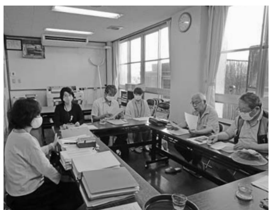
監査を受ける日下小学校