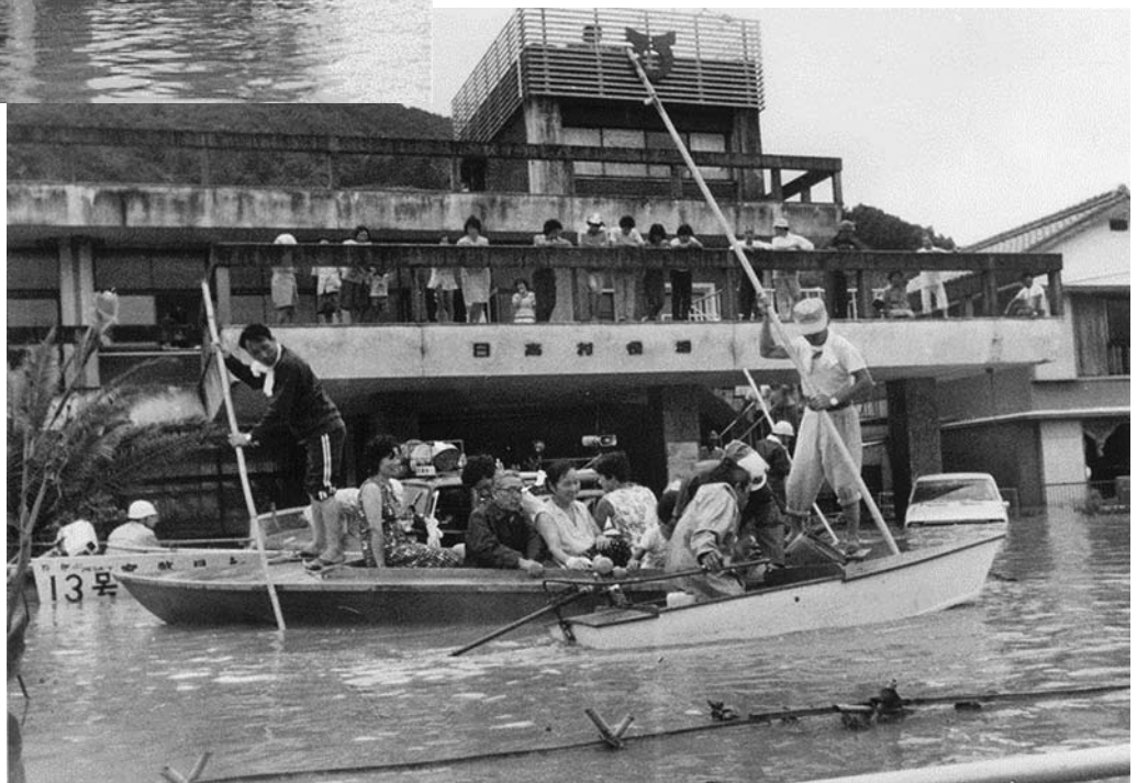
昭和50年台風5号災害(日高村役場)