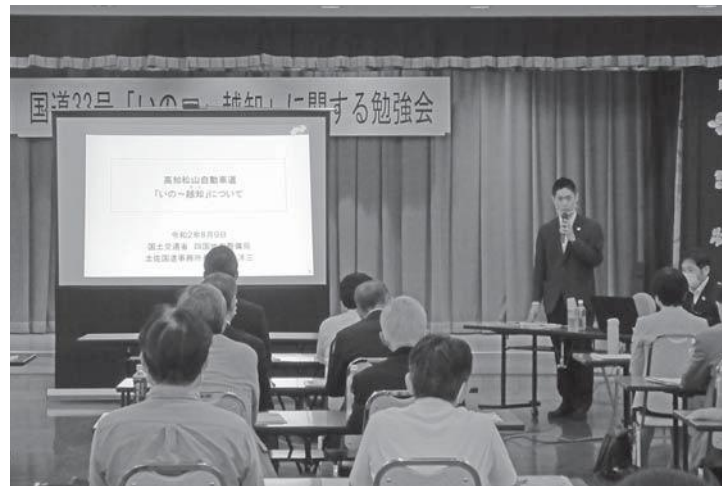
国道33号いのち越知勉強会

の意見等をヒアリングする場を設け、機会を見て、国へ日高村としての意見や要望などを行っていく。