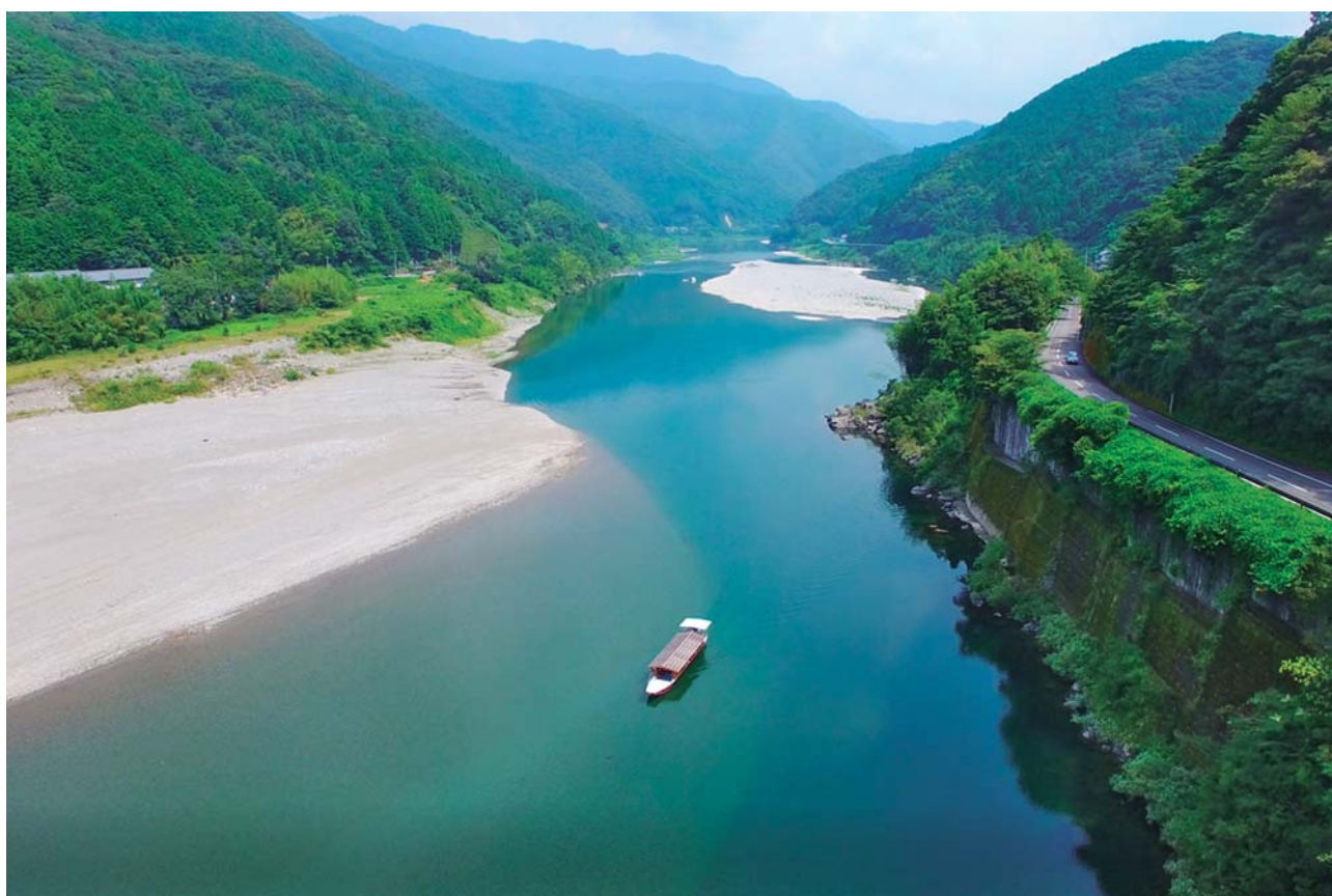
「水質が最も良好な河川」に選ばれた仁淀川