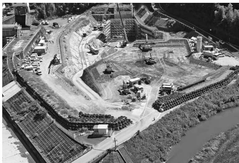
新規放水路呑口 現在の状況

年6月9日〜令和3年2月26日で発注した。新規放水路工事、8月17日現在呑口方向345・05m掘削完了、吐口方向1千555m残延長950m。