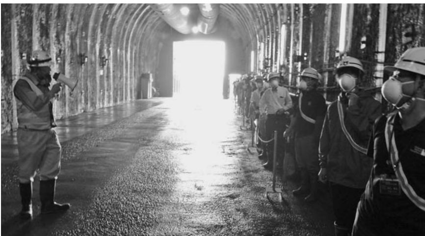
観光資源として生かしたい、日下川新規放水路斜坑口

提案のあった、村の治水に関する歴史を学べる場であるとか、観光資源と、どうつなげるか、大事なポイントと考える。