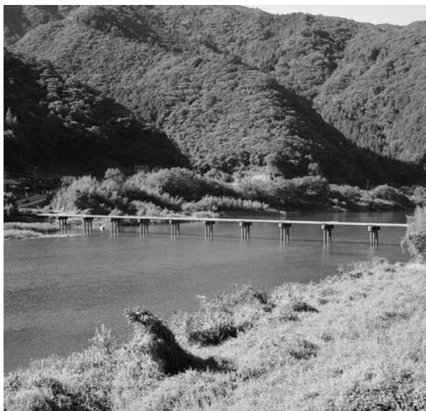
観光客に人気の名越沈下橋