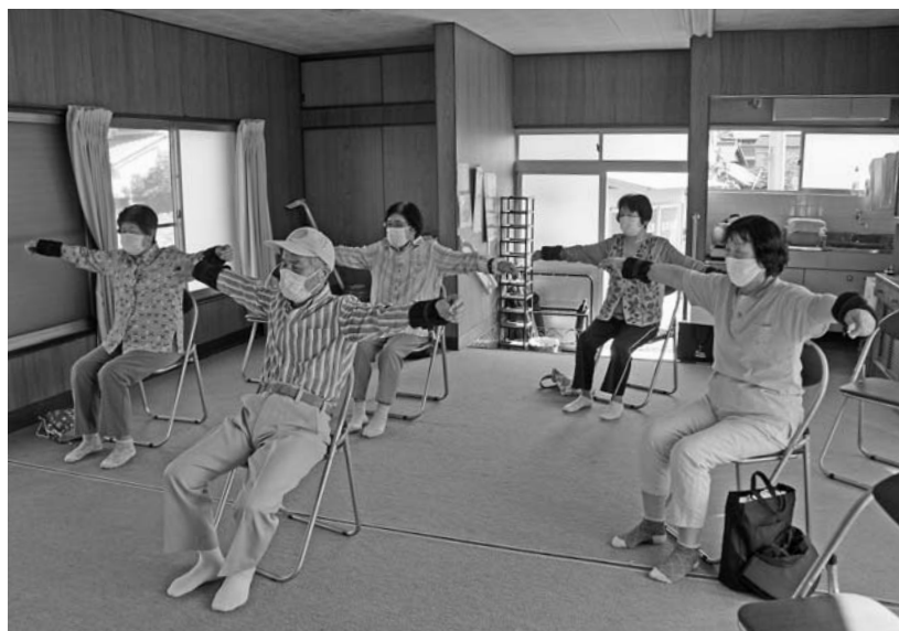
ご近所の仲間と一緒に100歳体操

答弁 谷脇健康福祉課長 7月末時点の介護認定者は362人で介護保険サービスは村内外の事業所利用ができ、訪問看護、訪問リハビリ、居宅医療管理指導等で医療支援の体制が整ってきている。様々な生活支援策もある。今後も自助・互助・共助を考えながら作り上げていきたい。