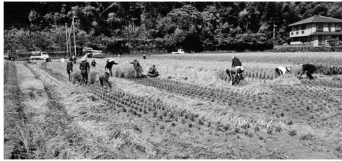
距離をとった稲刈り (能津小)

で競技をすることになる。修学旅行について、日高中学校2年生は来年の5月に延期。小学校は、今年中に決行したい。バスを大型にし、教育委員会で予算化していきたい。