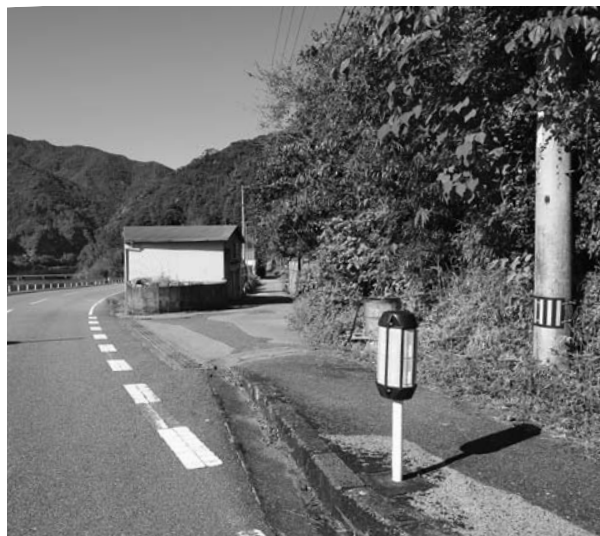
柱谷バイパス完成後に着手する中名越屋～下名越屋間改良工事