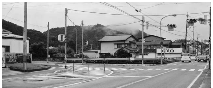
完成が待たれる日下橋交差点改良事業

また、東側への歩道延伸計画については、地権者各位のご理解のもと用地調査等に着手している。