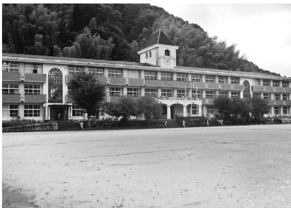
日下小学校 (本文書・陳情等には関係ありません。)