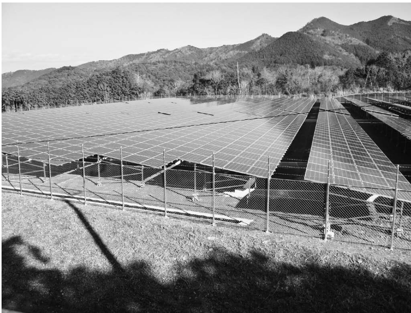
地域還流メガソーラー発電所

平成26年度決算見込みは、基金残高は増額、各会計は黒字決算の見込みであり、監査委員の審査後、9月議会で審議をいただくこととなる。