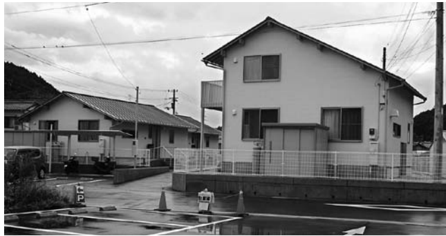
完成した清水田団地

4月1日、村営住宅清水田団地に岡花団地の入居者2戸4人と公募による3戸10人の入居(村内在住の子育て世帯)を決定した。また、各戸1台の駐車場であるため、駐車場の確保に苦勞されている。