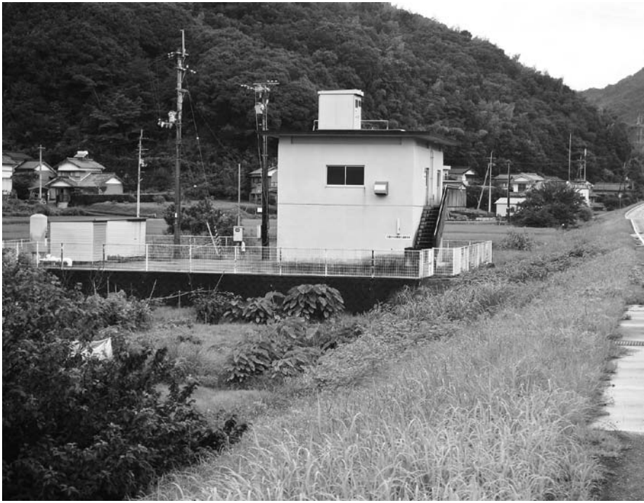
江尻簡易水道管理棟