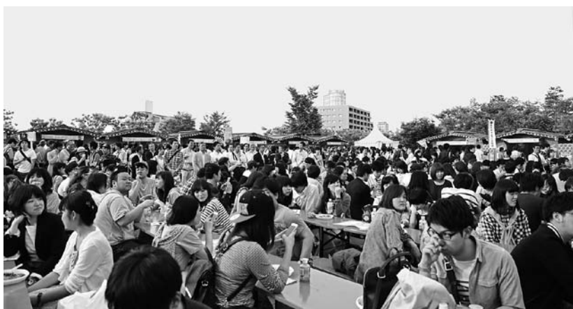
オムライスタジアムの会場

5月には、東京都で開催された、カゴメ株式会社主催のオムライスタジアムへ四国予選を勝ち抜いた、レストラン高知の「南国土佐のオムライス」が出場し、2日間で1千835食を完売し「日高村オムライス街道」を全国にPRしていただいた。人気投票、ウェブ投票とも準グランプリを獲得した。また、地域の食材にこだわった点などを評