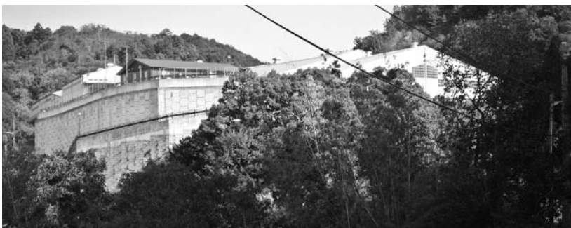
エコサイクルセンター