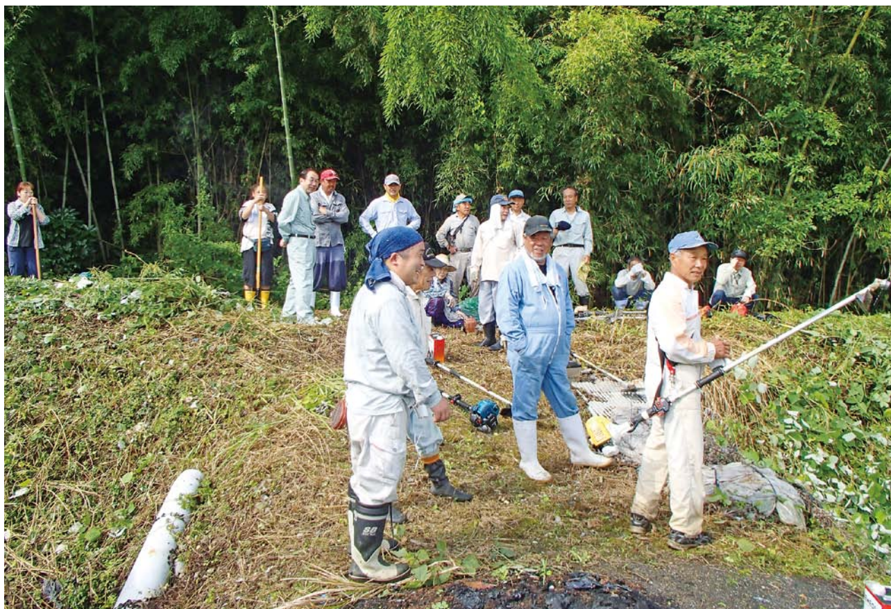
6月28日の村内一斉清掃