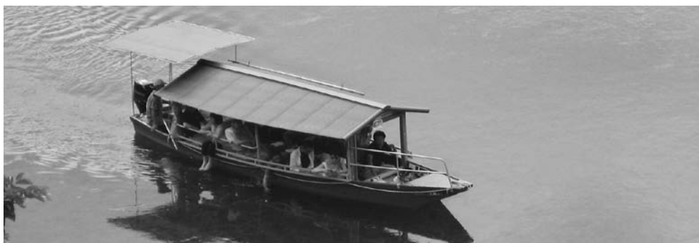
屋形船仁淀川の遊覧風景

平成25年度より85人増となる。また、初の取り組みをした「猿田洞ケイビング」の参加者は、24人となった。体験型観光、自然を体感する観光として、更に売り出しに力を入れていきたい。