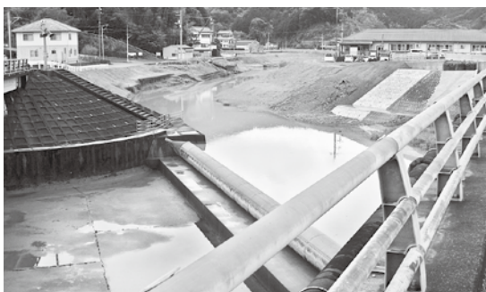
戸梶川上流を望む