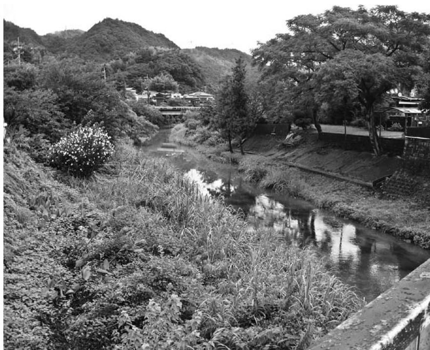
日下川下流域を望む(国道33号日下橋より下流)

高知県・日高村地域還流メガソーラー発電事業の2月から4月の発電量と売電額は、当初計画を大きく上回っているとの報告を受ける。