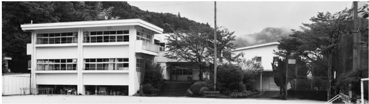
能津小学校 (本文書・陳情等には関係ありません。)