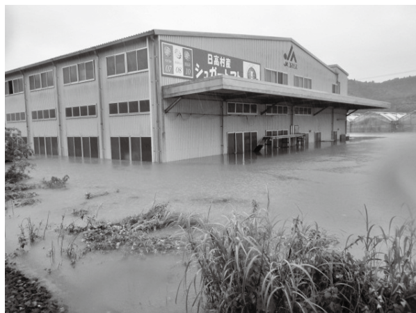
昨年の台風による浸水被害

学校4年生ぐら いの男子児童 に、大きな声で 「おはようござ います」の挨拶 を受け、朝から 非常に清々しく 元気百倍の気分 にしていただ いた。これは、学 校が進めている 挨拶運動の成果 だと思うが、こ