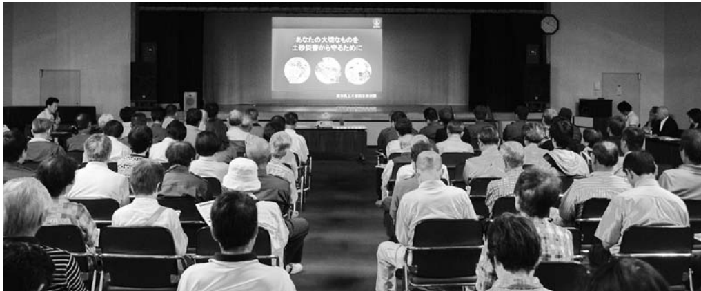
日高村防災学習会（講演会風景）

今年度より、子ども子育て新支援制度がスタートした。保育所の入所状況は、4月1日現在、標準時間（11時間保育）認定137人、短時間（8時間保育）認定29人であり、全員が希望する入所となっている。 以上の報告を受けた。