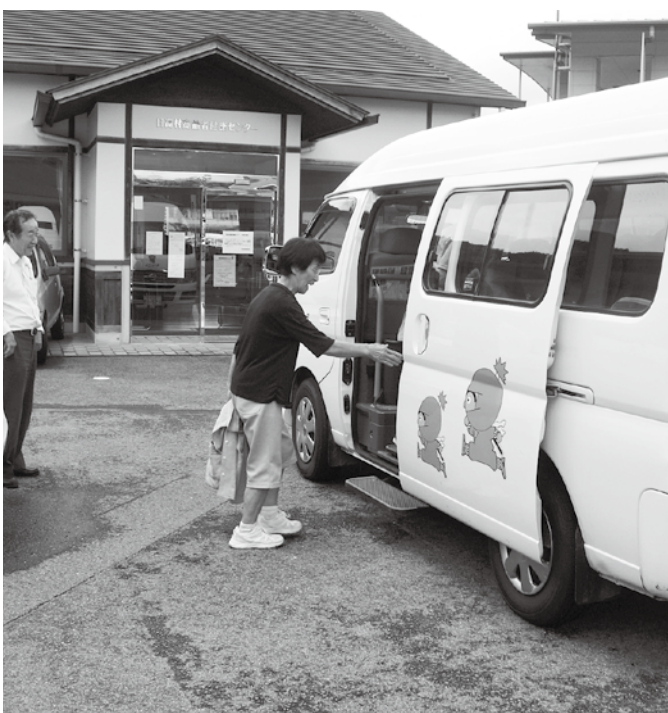
デマンドバスの運行(利用)