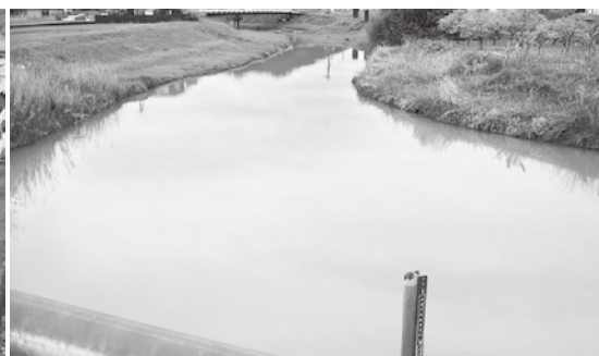
日下川上流を望む