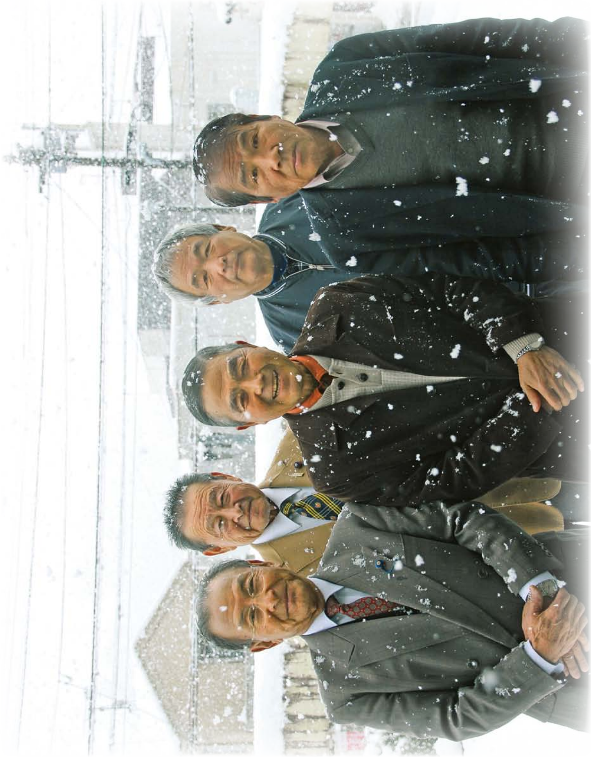
議会広報発行調査特別委員会委員の顔ぶれです