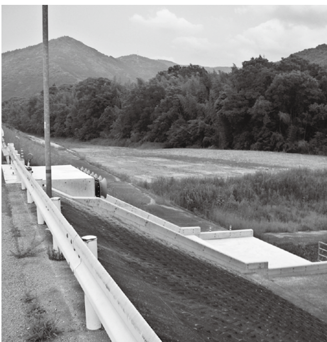
江尻親水公園予定地