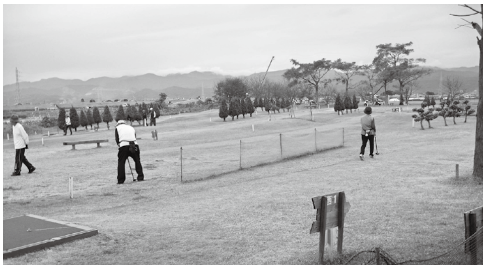
高知県香南市野市町親水公園

東みよし町ならびにつるぎ町の職員の皆様には、ご多用の中にもかかわらず丁寧なご教示を賜り、心より厚く御礼を申し上げます。