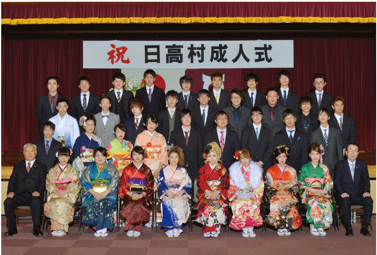
平成28年 成人式 (H28.1.10)