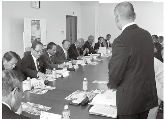
東みよし町で意見交換