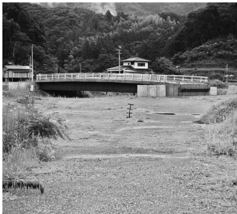
沖名八幡前橋の現況

岩盤までの地質を同一と推測して対応したことが原因では。事前調査が十分ではないか。