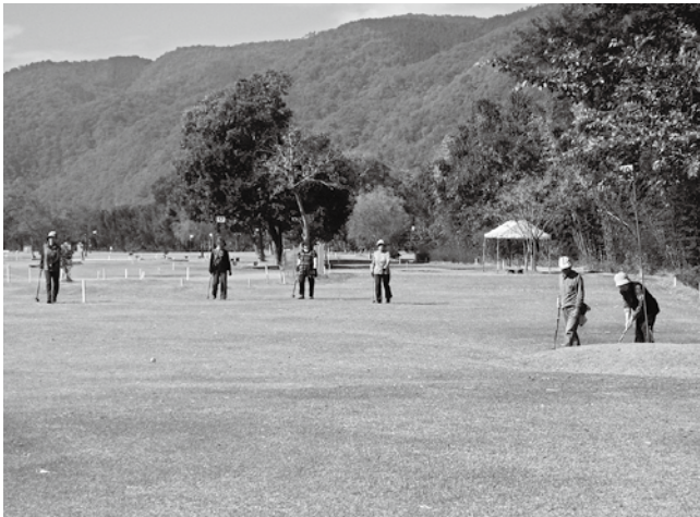
東みよし町親水公園

村は現在、江尻親水公園の整備に向けて計画中であり、常任委員会合同で、県内外の近隣町村の整備された親水公園の規模、整備費用、管理状況等について視察研修を行った。