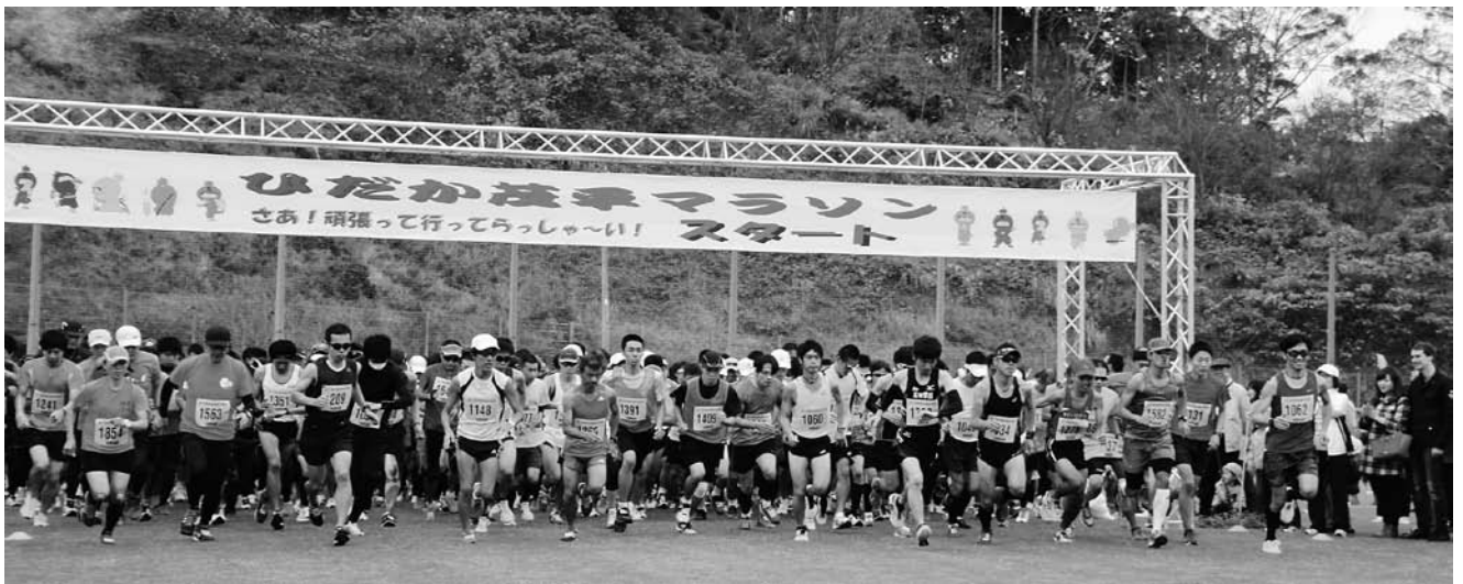
ひだか茂平マラソン