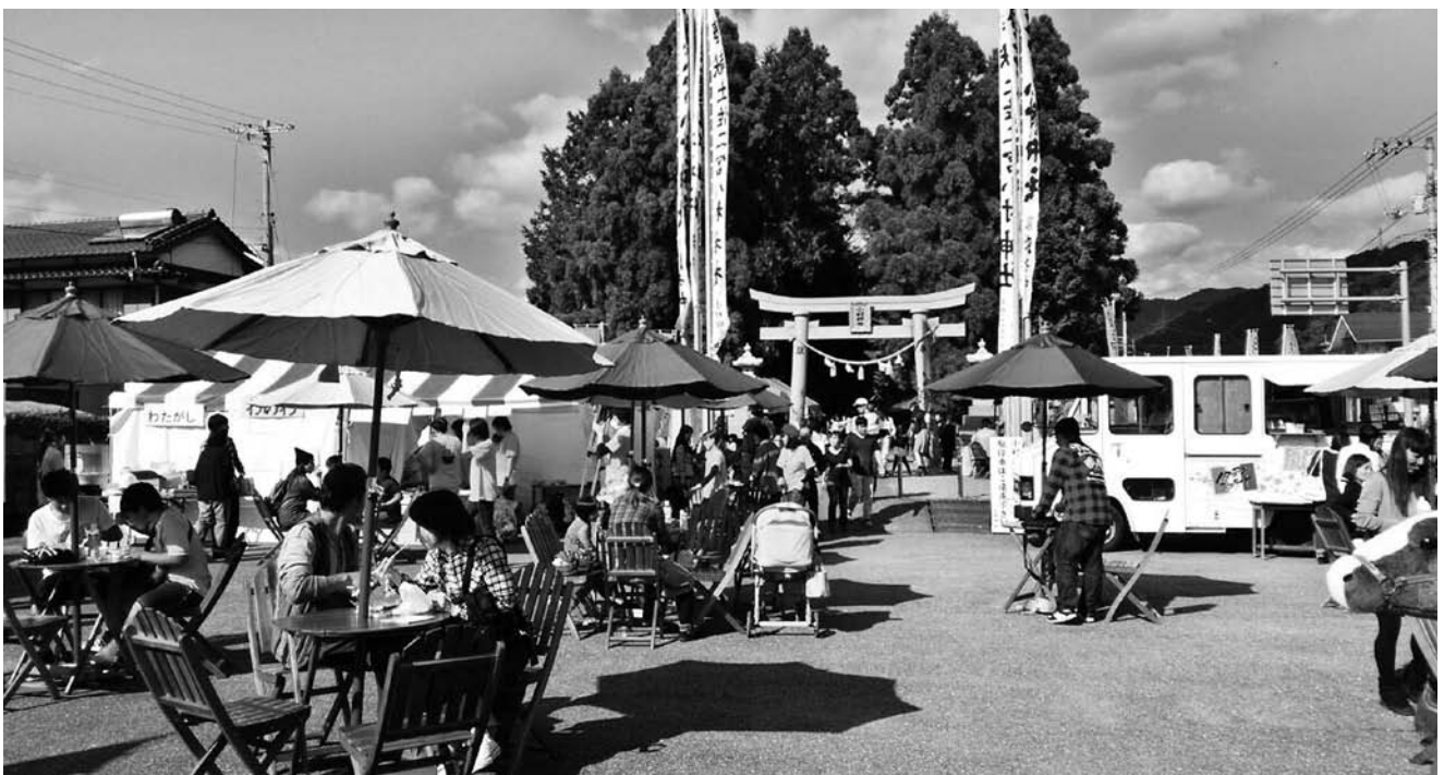
日高メシふえすていばる

11月15日に日高メシふえすていばるが小村神社大祭に合わせて、参道等で開催され、多くの来場者でにぎわった。これは、NPO法人わのわ会などが、「オムライス街道」をさらに盛り