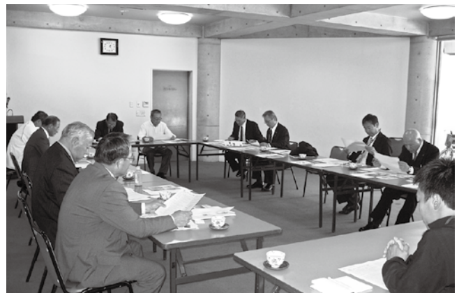
つるぎ町で意見交換